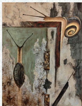
波多江真純（日本画）